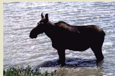
Orignal ( kanāy )