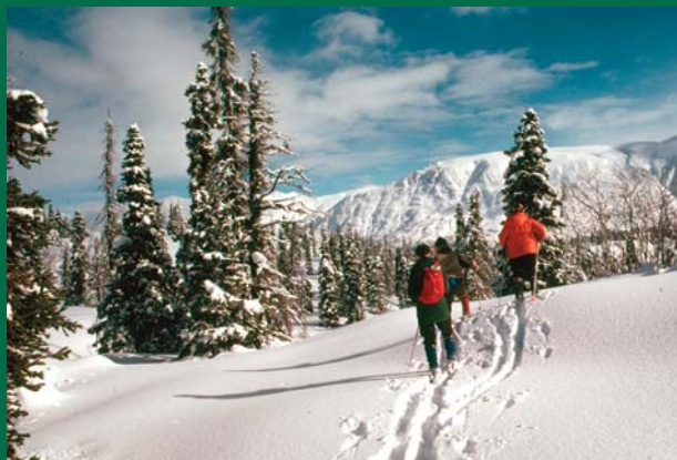
Ski de fond