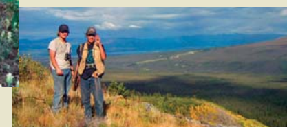
Jeunes de la Première nation Kluane