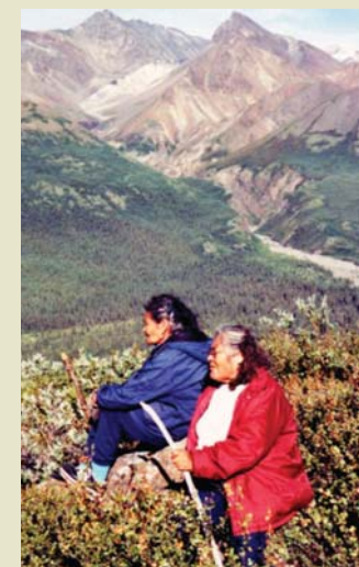
Aînées de la Première nation Kluane