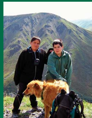
Jeunes de la Première nation Kluane