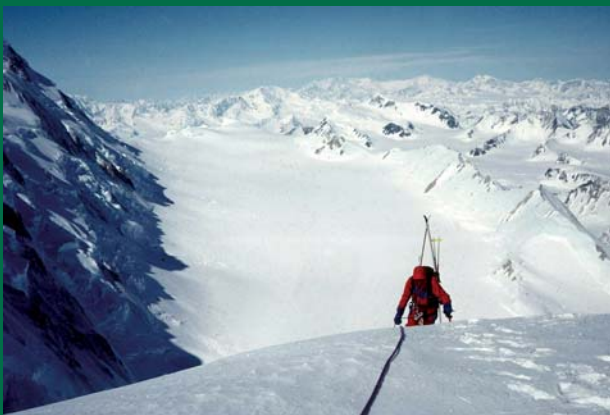
Alpinisme - champs de glace de Kluane