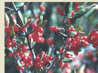
Shépherdie du Canada ( nighru )

Le chevauchement des masses d'air du Pacifique et de l'Arctique au-dessus de Kluane a donné naissance à une flore et à une faune parmi les plus variées du Nord du Canada. La végétation du parc est généralement représentative de la forêt boréale. La végétation n'occupe qu'environ 18 p. 100 de la superficie du parc, et la forêt, 7 p. 100. Cette forêt alpestre composée d'épinettes blanches ( ts'u ), de peupliers faux-tremble ( t'ii ) et de peupliers baumiers ( t'ii ) recouvre la majeure partie des vallées et des avants-monts. Des arbustes à croissance lente ou rabougris saules ( k'äy ), bouleaux glanduleux ( tru ) et aulnes ( keshiir ) poussent dans la zone subalpine. L'été transforme la zone alpine en une féerie de couleurs: on y dénombre plus de 200 variétés de fleurs.