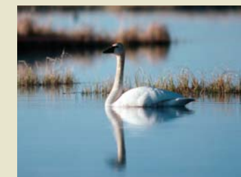
Cygne trompette ( dägäy )

Les communautés végétales offrent un habitat pour toutes sortes d'espèces d'animaux sauvages. Kluane abrite une population de grizzlis ( shār sho ) qui se répand dans le parc et dans la région. Les grizzlis sont considérés un indicateur de la santé de l'écosystème. D'autres espèces comme le loup ( ägäy ), le lynx ( nädäy ), la chèvre de montagne ( ambäy ), l'orignal ( kanäy ), l'ours noir ( shār zhü ) et le mouflon de Dall ( mäy ), les gros mammifères les plus communs de Kluane, fréquentent aussi le parc et les environs. La diversité de l'habitat, tant à l'intérieur du parc qu'à l'extérieur, explique également la grande variété d'oiseaux qu'accueille le parc. Plus de 180 espèces y ont été signalées dont des cygnes trompettes ( dägäy ) et des populations de rapaces comme les faucons pèlerins ( nāda ), les faucons gerfauts ( nāda ) les pygargues à tête blanche et les aigles royaux ( chündäy et thäy ). Les lacs et autres plans d'eau du parc recèlent des touladis ( mbet ), des grands brochets ( tāte ), des ombles arctiques ( t'āwa ) et plusieurs autres espèces de poissons. On y trouve de plus le kokani, un saumon confiné aux eaux intérieures du lac Kathleen, du lac Louise et du lac Sockeye. Cette espèce unique forme la seule population naturelle à se trouver dans un parc national au Canada.