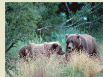
Grizzlis ( shār sho )

Les communautés végétales offrent un habitat pour toutes sortes d'espèces d'animaux sauvages. Kluane abrite une population de grizzlis ( shār sho ) qui se répand dans le parc et dans la région. Les grizzlis sont considérés un indicateur de la santé de l'écosystème. D'autres espèces comme le loup ( ägäy ), le lynx ( nädäy ), la chèvre de montagne ( ambäy ), l'orignal ( kanäy ), l'ours noir ( shār zhü ) et le mouflon de Dall ( mäy ), les gros mammifères les plus communs de Kluane, fréquentent aussi le parc et les environs. La diversité de l'habitat, tant à l'intérieur du parc qu'à l'extérieur, explique également la grande variété d'oiseaux qu'accueille le parc. Plus de 180 espèces y ont été signalées dont des cygnes trompettes ( dägäy ) et des populations de rapaces comme les faucons pèlerins ( nāda ), les faucons gerfauts ( nāda ) les pygargues à tête blanche et les aigles royaux ( chündäy et thäy ). Les lacs et autres plans d'eau du parc recèlent des touladis ( mbet ), des grands brochets ( tāte ), des ombles arctiques ( t'āwa ) et plusieurs autres espèces de poissons. On y trouve de plus le kokani, un saumon confiné aux eaux intérieures du lac Kathleen, du lac Louise et du lac Sockeye. Cette espèce unique forme la seule population naturelle à se trouver dans un parc national au Canada.