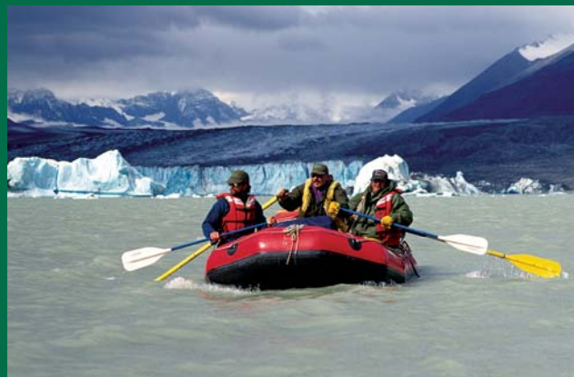
Descente en eaux vives – rivière Asek