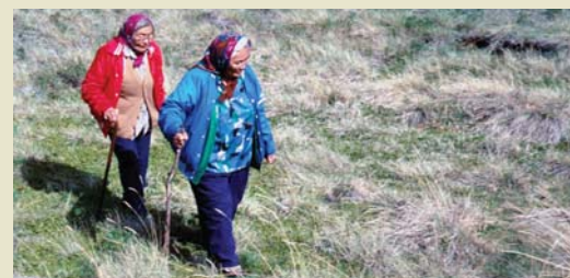
Aînées des Premières nations Champagne et Aishihik

Le parc national et la réserve de parc national Kluane font partie du territoire ancestral des Tutchonis du Sud. Pendant des millénaires, dän (le peuple) a adopté un mode de vie efficace pour survivre sur ce territoire fait d'extrêmes. Les anciens racontent l'histoire passionnante de ce peuple et décrivent en détail des événements et des lieux qui remontent à de nombreuses générations.