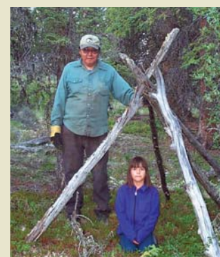
Ainé et jeune des Premières nations Champagne et Aishihik

Les Tutchonis du Sud étaient autrefois un peuple nomade qui parcouraient de grandes distances pour profiter de l'abondance saisonnière de faune et de flore à travers leur territoire traditionnel. Ce mode de vie exigeait d'eux qu'ils soient maîtres de l'art de la chasse et des déplacements dans une région en proie à des variations climatiques et géographiques radicales. Ce sont la précision et la profondeur de leur langue qui ont permis aux Tutchonis du Sud de survivre. Les anciens transmettaient oralement les enseignements officiels et les histoires traditionnelles, et cette pratique se poursuit encore aujourd'hui. Les toponymes et les histoires qui leur sont associés constituent une source de savoir essentielle: ils identifiaient les endroits où se trouvaient les ressources, faisaient références à des événements passés, et décrivaient le paysage de façon à ce qu'un voyageur ait connaissance d'un endroit sans y être allé auparavant.