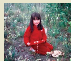
Jeune de la Première nation Kluane

Aujourd'hui, la culture des Tutchonis du Sud est d'une grande richesse, et elle est solidement liée au monde naturel. Le renouvellement de ces liens avec le territoire traditionnel qui se trouve dans le parc et l'orientation à donner à la gestion des ressources naturelles constituent des priorités pour les Premières nations Champagne et Aishihik et pour la Première nation Kluane. Cette réintégration culturelle permettra aussi de faire en sorte que le savoir traditionnel de ces Premières nations soit reconnu et transmis aux générations futures.