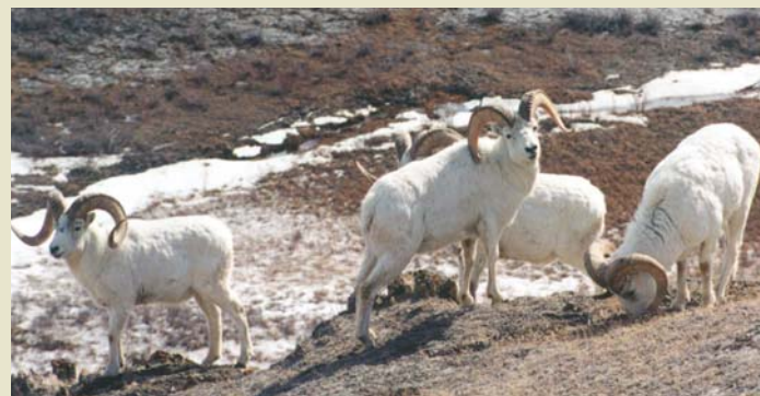
Mouflons de Dall mâles ( māy shayan )

Pour s'acquitter de ses responsabilités à cet égard, l'administration de Kluane a choisi d'adopter une approche globale et travaille en collégialité afin de créer un écosystème sain et durable. Par leur savoir traditionnel, les Tughtonis du Sud contribuent à préserver l'intégrité écologique de la région, et leurs connaissances sont intégrées à la gestion qui se fait aujourd'hui dans le parc. Nous unissons nos efforts en vue d'atteindre notre but commun, soit l'intégrité écologique du parc, et nous veillons à ce que les décisions touchant l'utilisation des terres tiennent compte des interactions complexes et de la nature dynamique des écosystèmes du parc, ainsi que de leur capacité limitée à supporter des perturbations et à s'en remettre.