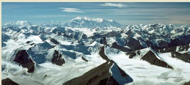
Mont Logan en arrière plan

Situés à l'extrémité sud-ouest du Yukon, la réserve et le parc national Kluane comptent parmi les nombreux trésors nationaux dont Parcs Canada assure la protection. Les parcs nationaux du Canada sont créés pour protéger des secteurs représentatifs de régions naturelles uniques en leur genre. La réserve et le parc national Kluane représentent la région de la Chaîne Côtière du Nord. D'une superficie de 21 980 km 2 , cette aire protégée est faite de montagnes massives, d'immenses champs de glace et de vallées luxuriantes, sans compter la richesse des espèces végétales et animales qu'elle abrite. Cet impressionnant paysage naturel fait partie du territoire traditionnel des Tughtonis du Sud, qui sont représentés dans la région de Kluane par les Premières nations Champagne et Aishihik et par la Première nation Kluane. Aujourd'hui, Parcs Canada et ces premières nations se partagent la responsabilité de la gestion des ressources naturelles et culturelles du parc.