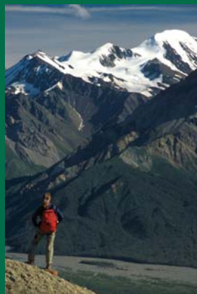
Randonnée - Plateau Bullion