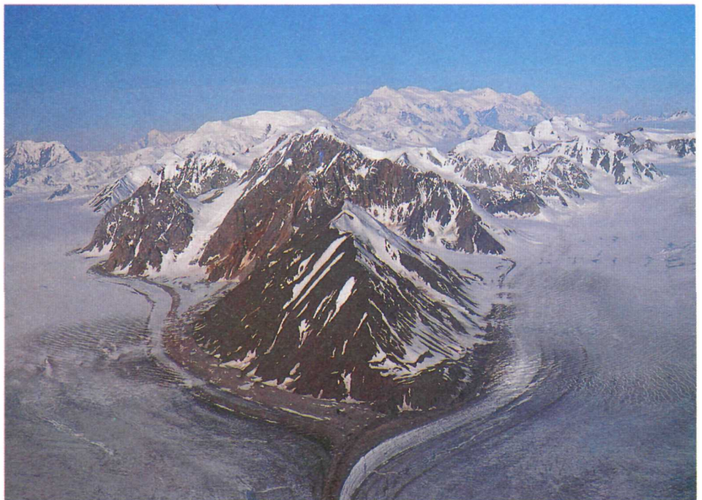
Upper Kaskawulsh Glacier. Glacier Kaskawulsh supérieur.