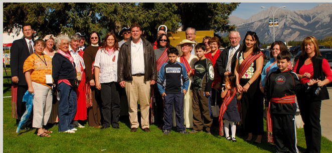
Sur la photo figurent des membres des familles Hanly, L'Hirondelle et Loyer en compagnie du ministre de l'Environnement et ministre responsable de Parcs Canada, l'honorable John Baird; aussi, des membres des Loyalistes de l'Empire-Uni du Canada ainsi que des membres de la famille Wilson de Hinchinbrooke, Québec, représentant la Société historique de la Vallée de la Châteauguay, Jasper 2007.

Il est étonnant que le nom d'un simple commerçant de fourrures, ayant vécu à une époque et dans un lieu marqués par de continuels changements, ait ainsi été immortalisé et soit maintenant connu dans le monde entier.