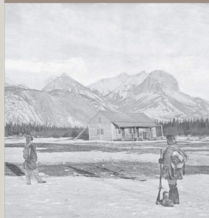
Jasper House II, Charles Horetzky, 1872. Bibliothèque et Archives Canada, numéro d'entrée 1936-270 NPC

Découvrez comment un simple commerçant de fourrures a donné son nom à un trésor national.