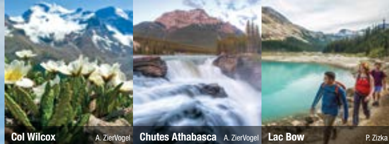
Col Wilcox A. ZierVogel Chutes Athabasca A. ZierVogel Lac Bow P. Zizka