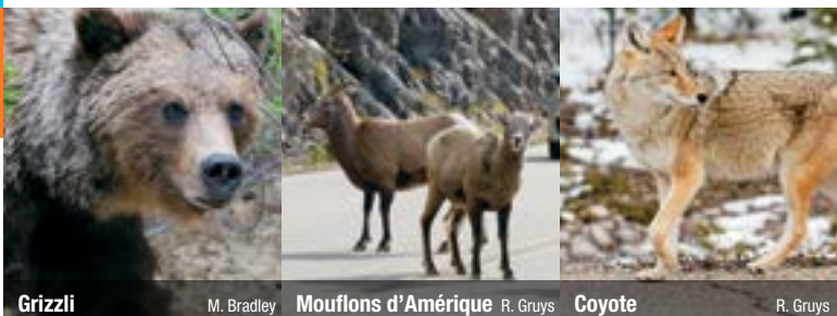
Grizzly M. Bradley Mouflons d'Amérique R. Gruys Coyote R. Gruys

C'est de ses eaux turquoise que la rivière Bow tire sa source. Un des bassins d'eau les plus panoramiques et les plus accessibles pour la pêche.