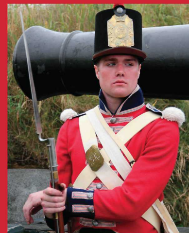
Un représentant de la garnison de la citadelle pendant la guerre de 1812 fait partie de la commémoration 200 e anniversaire.