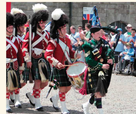
Le 78 e régiment des Highlanders exécute quotidiennement des démonstrations de la période.