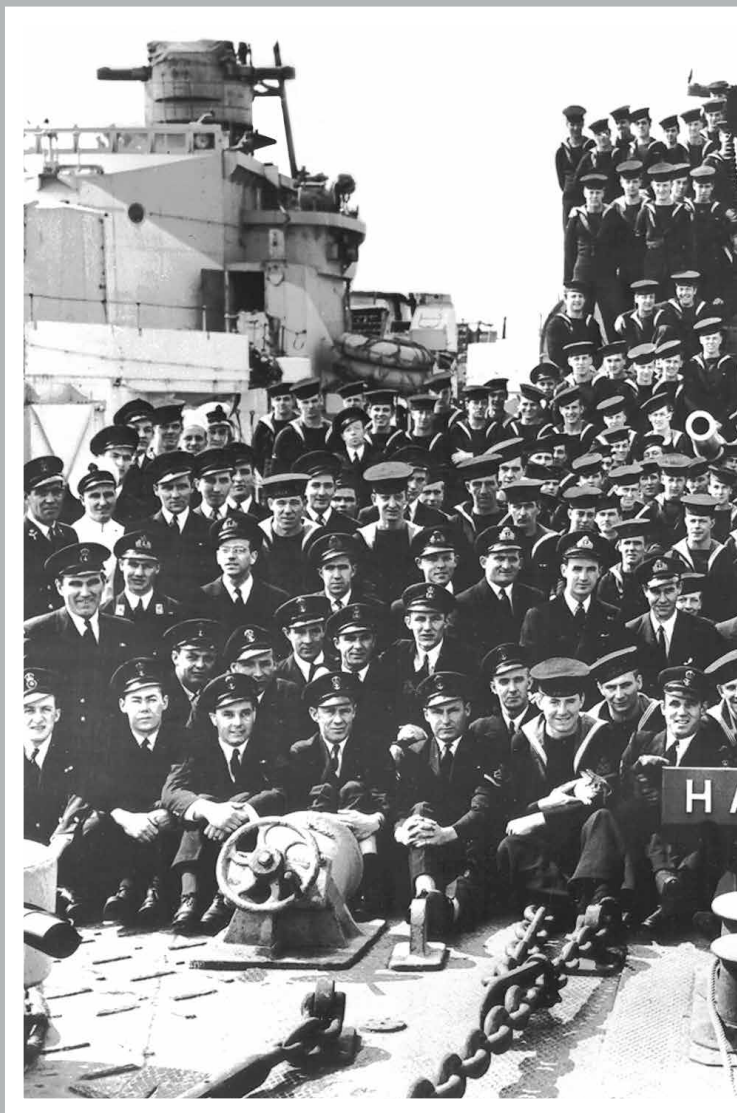
Початковий екіпаж, 1943 рік.