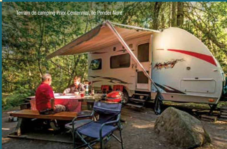
Terrain de camping Prior Centennial, île Pender Nord