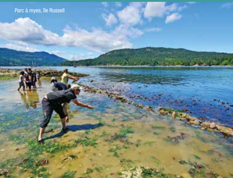
Parc à myes, île Russell