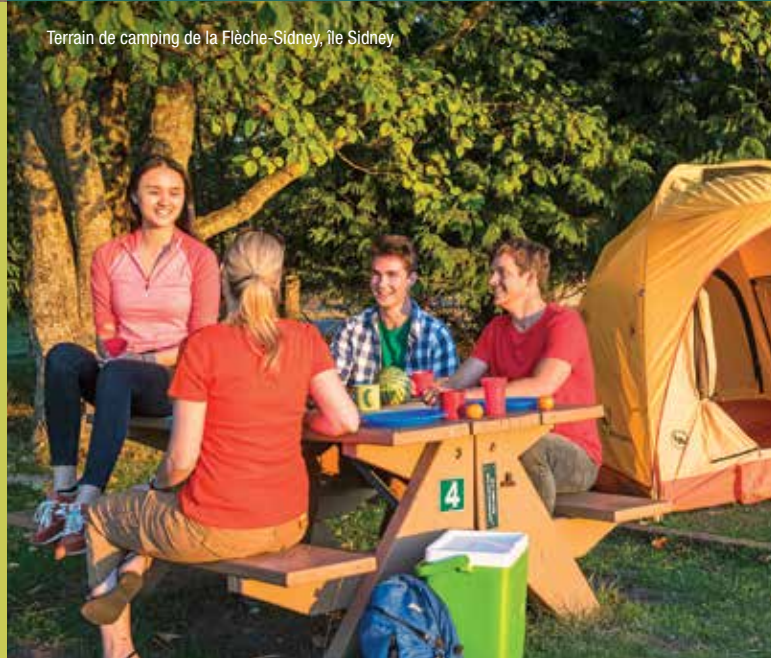
Terrain de camping de la Flèche-Sidney, île Sidney