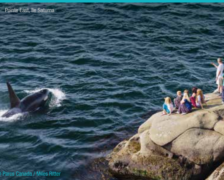
Pointe East, île Saturna