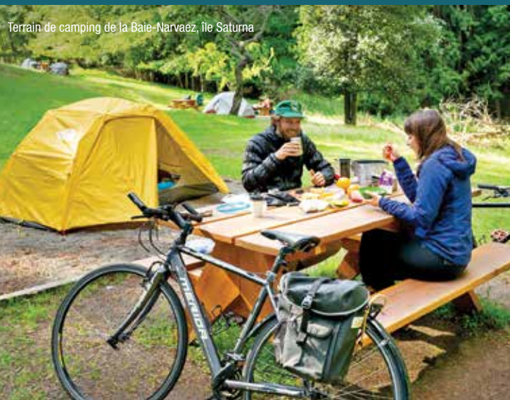
Terrain de camping de la Baie-Narvaez, île Saturna