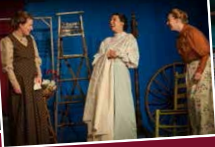
THE YOUNG LADIES OF BADDECK CLUB