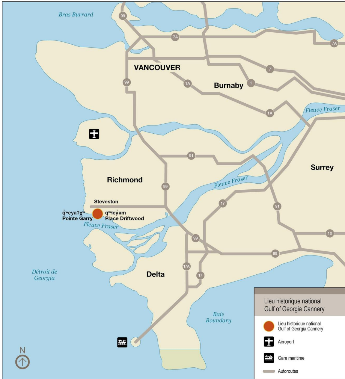
Carte 1 : Emplacement de lieu historique national Gulf of Georgia Cannery dans la région métropolitaine de Vancouver

aborder l'histoire du Canada et orientera le plan d'interprétation, qui tient compte des valeurs et des possibilités du lieu historique et qui, en outre, reconnaît les motifs de la désignation à titre de lieu historique national.