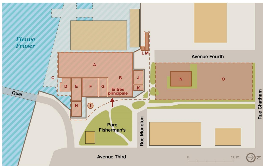
Carte 3 : Plan du lieu historique national Gulf of Georgia Cannery