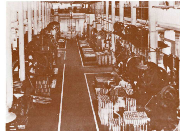
The workshop of the Dominion Arsenal.

The restoration of the park by the Department of Indian and Northern Affairs takes on even more importance at this time because other organizations, private and governmental, are also involved in the development of Old Québec.