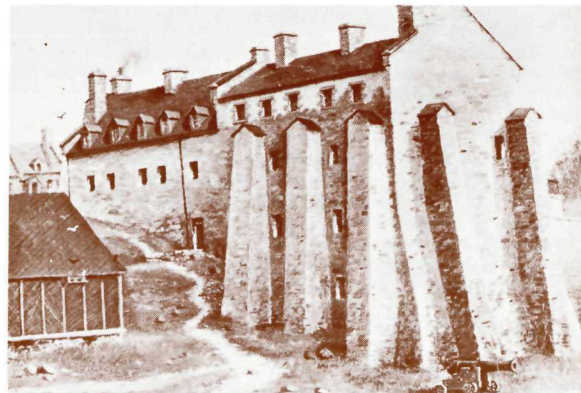
The Dauphine Redoubt in 1886. H. Bunnett. (McCord Museum, Montréal).

1832, the gun-carriage depot built in 1816 and 1833, and the Captain's Quarters in 1818. Following the departure of the British Army in 1871, Artillery Park became the property of the Canadian Government, which, in 1880, established a cartridge factory here.