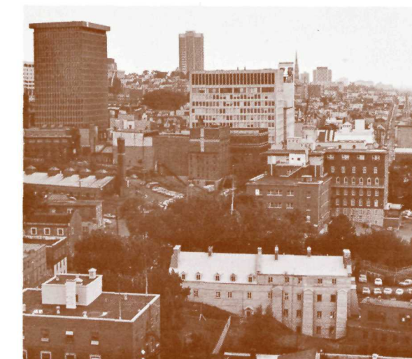
La redoute Dauphine à vol d'oiseau.

La restauration du parc par le ministère des Affaires indiennes et du Nord prend d'autant plus d'importance qu'au même moment d'autres organismes, privés ou gouvernementaux, oeuvrent à mettre en valeur le Vieux Québec.