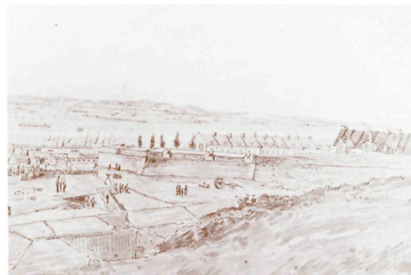
Le demi-bastion de la Potasse et le glacis vers 1830 par James Pattison Cockburn. Collection Sigmund Samuel. Royal Ontario Museum, Toronto.

D'abord capitale et porte d'entrée de l'immense empire français d'Amérique qui s'étendait jusqu'au golfe du Mexique, Québec faisait partie du réseau de places fortes et de forts qui jalonnaient la Nouvelle-France. Jusqu'à la fin du 18e siècle, le système de fortifications de Québec consistait en un mur de maçonnerie comptant six bastions et fermant la ville du côté ouest depuis les hauteurs du Cap jusqu'à l'embouchure de la Saint-Charles. Cette ligne de défense fut construite par Chaussegros de Léry pour protéger la capitale de la Nouvelle-France à la suite de la chute de Louisbourg en 1744. Les transformations opérées par les autorités militaires britanniques, puis canadiennes, ont rendu ces vieilles fortifications françaises méconnaissables.