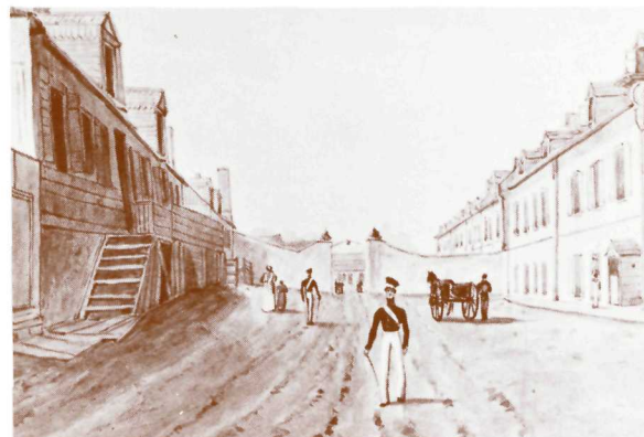
L'entrée principale du Parc de l'Artillerie en 1830 par James Pattison Cockburn. Archives du Séminaire de Québec.

Les bastions Saint-Jean et de la Potasse qui font partie du système construit par de Léry, sont inclus dans le projet de restauration du Parc de l'Artillerie. Dans l'ensemble des fortifications, leur position devait défendre l'embouchure de la Saint-Charles là où le terrain n'offrait pas de résistance naturelle. Aussi c'est par des pièces d'artillerie montées à l'arrière des Nouvelles Casernes, soit à droite du demi-bastion de la Potasse, qu'en 1775 Carleton fit bombarder l'ancien palais de l'intendant où s'étaient logés les Américains. (les voûtes Talon aujourd'hui). Ces derniers sous la conduite de Arnold et de Montgomery tentèrent vainement de prendre la ville au cours de l'hiver 1775-1776.