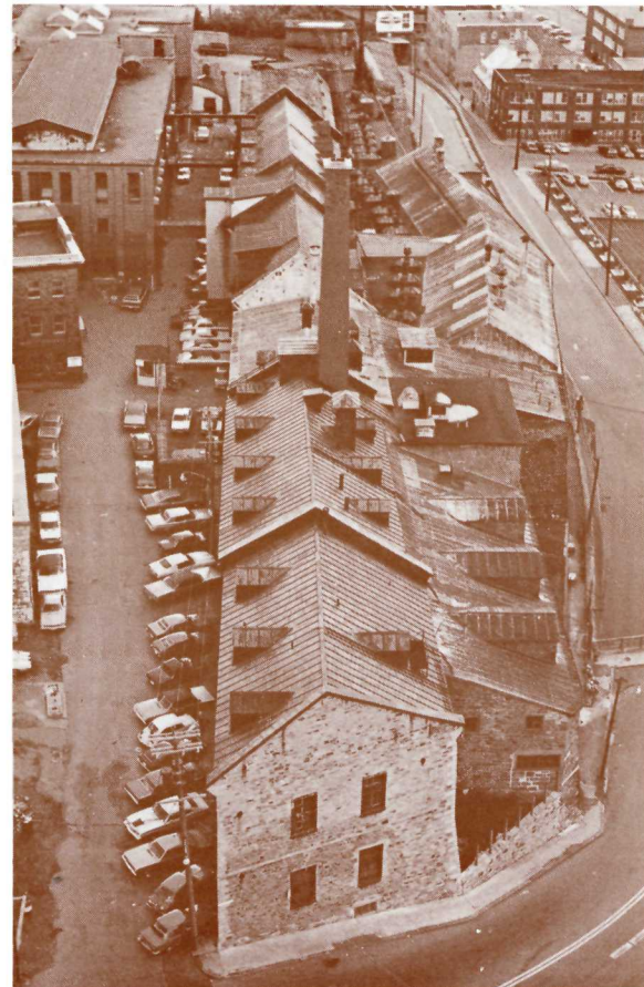
Aerial view of the Palace Gate Barracks. (Parks Canada, 1973).

1972, and the summer of 1973 marked the beginning of the archaeological digs. Work was begun at this time in solidifying the structure of several buildings within the park.