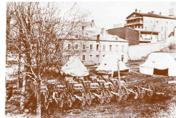
Le corps de garde construit en 1832.

Historiens, ingénieurs, archéologues, architectes et autres spécialistes établissent actuellement les données les plus exactes possibles sur l'état passé et actuel des constructions et sur leurs possibilités de restauration. Sans tenter de favoriser une période distincte de l'histoire du parc, on analyse la valeur architecturale, archéologique et historique des nombreux édifices qui s'y élèvent.