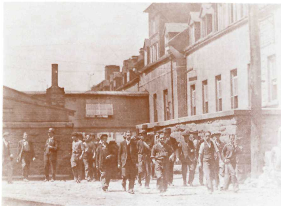
Workers at the Dominion Arsenal leave the factory one fine day in the summer of 1941. At that time the Dominion Arsenal produced ammunition. The demands of the Second World War were such that the factory operated around the clock, in three shifts of eight hours each, every day of the week, including Sunday.

The Artillery Park project includes the renovation of five houses on the Côte du Palais opposite the Hôtel-Dieu Hospital. These houses illustrate well the development of civil architecture in Old Québec. The Flamand house, which is being restored, was built in the mid-18th century by one of the big entrepreneurs of the city. Nearby was the Québec Gas Co. building, built in 1865. Natural gas was stored here in a huge tank 72 feet across and 22 feet deep. As originally constructed the gas reservoir was a fine example of industrial architecture from the late 19th century, but subsequent modifications destroyed its form and it has been demolished.