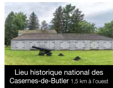
Lieu historique national des Casernes-de-Butler 1,5 km à l'ouest