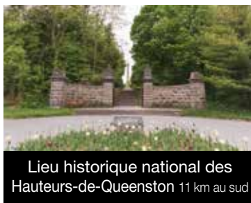
Lieu historique national des Hauteurs-de-Queenston 11 km au sud