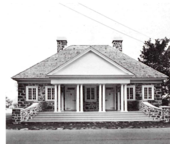
The Guard House at Fort Chambly Le Corps de garde près du fort Chambly

The colony, drawing its last breath and on the verge of collapse, welcomed with relief the arrival of the Carignan-Salières Regiment in 1665. Construction began immediately on a series of wooden forts on the Richelieu, including Chambly. By this action the French wanted to provide their army with a strong supply network when they would start a campaign to go get the Iroquois on their own territory. And furthermore these forts could become havens in case of attacks. The following year, a military expedition led by Prouville de Tracy against the Iroquois into their own territory forced them to ask for peace, which was officially concluded in Quebec City in July of 1667. In 1684, war broke out once again, this time in the West. Three years later they reappeared on the Richelieu River which, during the peaceful interval, had seen the development of some seigneuries, including Chambly.