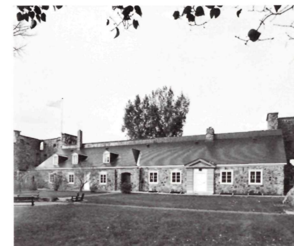
The West Curtain La courtine ouest

to Albany (called Orange during the Dutch years), an extremely important trading centre. The good prices for furs offered by the merchants, along with the higher quality of the trade goods, attracted many French traders and nearly all the Indians. This trade was extremely detrimental to the companies who held the monopoly in New France, since it deprived them of a sizeable income. Despite the severe fines for lawbreakers, there was a bright future ahead for this black market activity. In an attempt to avoid such dealings, the colonial authorities ordered the commanders of the advance posts to see that the regulations prohibiting such transactions were scrupulously upheld. As a result, Chambly witnessed the arrest of many smugglers and the seizure of their merchandise.