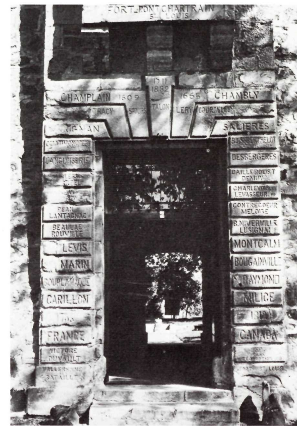
La porte d'entrée du fort Chambly Entrance gate of Fort Chambly

par les troupes anglaises fraîchement arrivées d'Europe. En juin elle évacuait les forts du Richelieu et regagna sa base de Crown Point à l'extrémité du lac Champlain. C'était la dernière fois qu'une armée d'invasion paraissait devant Chambly.