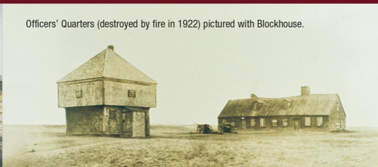
Officers' Quarters (destroyed by fire in 1922) pictured with Blockhouse.