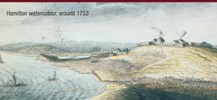
Hamilton watercolour, around 1753

A garrison remained at Fort Edward until 1850. Later it saw service during the American Revolution (1775-1783) and the War of 1812, providing security for the Windsor area and the route to Halifax. In 1917, during WWI, it became a base of training operations for the 38th, 39th, 40th and 42nd Battalions of the Royal Fusiliers known collectively as the Jewish Legion.