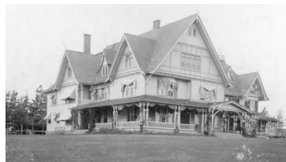
Dalvay-by-the-Sea, au début du XXe siècle .