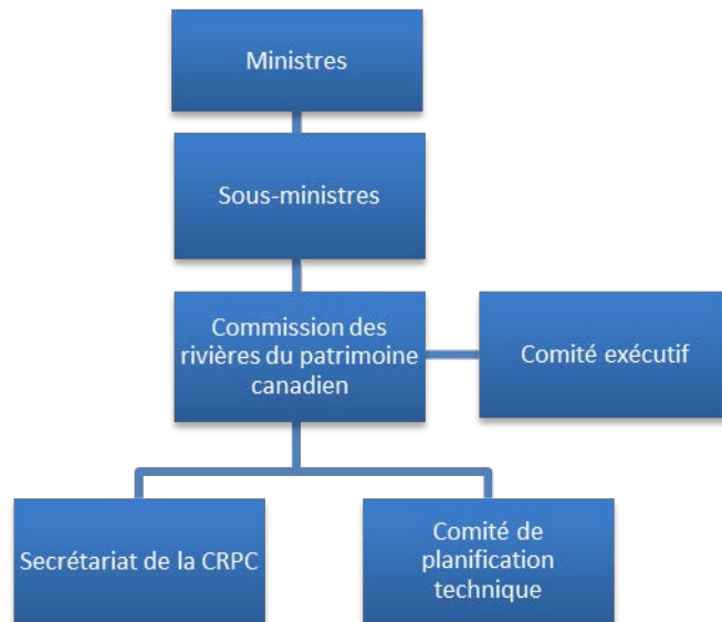
Figure 1. Organigramme illustrant les relations entre les organismes de gouvernance du RRPC

Commission est appuyé par un Comité de planification technique et les services de secrétariat fournis par Parcs Canada. Les différentes autorités membres paient les coûts associés à leur participation aux réunions de la Commission. La figure 1 présente un organigramme du RRPC.