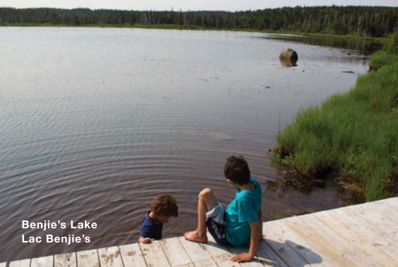
Benjie's Lake Lac Benjie's