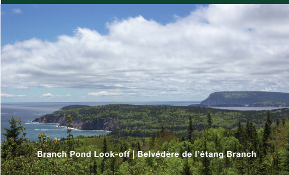
Branch Pond Look-off | Belvédère de l'étang Branch