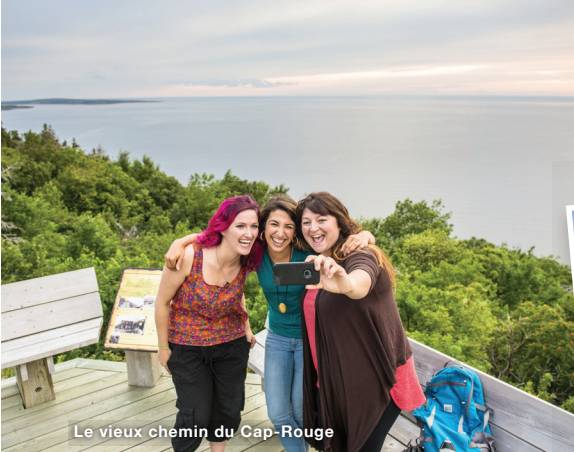
Le vieux chemin du Cap-Rouge