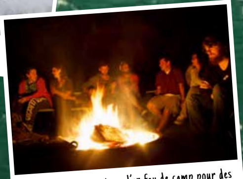
Rassemblez-vous autour d'un feu de camp pour des chansons, des histoires, des simores et plus.