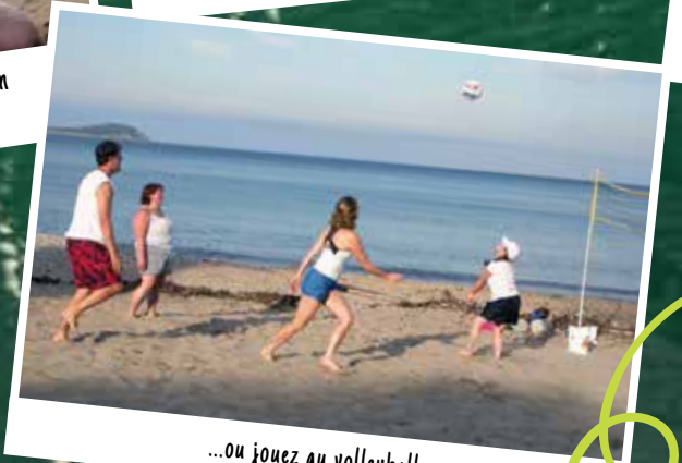
...ou jouez au volleyball.

Pour en savoir plus, procurez-vous la brochure « Supercali-PLAGEilistic! »