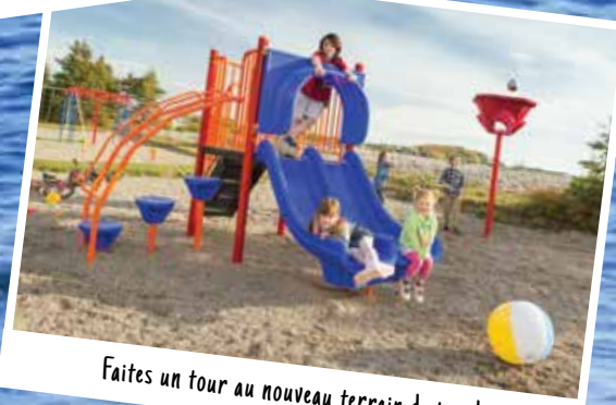
Faites un tour au nouveau terrain de jeux!