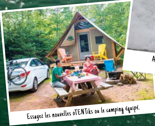
Essayez les nouvelles oTENTiks ou le camping équipé.