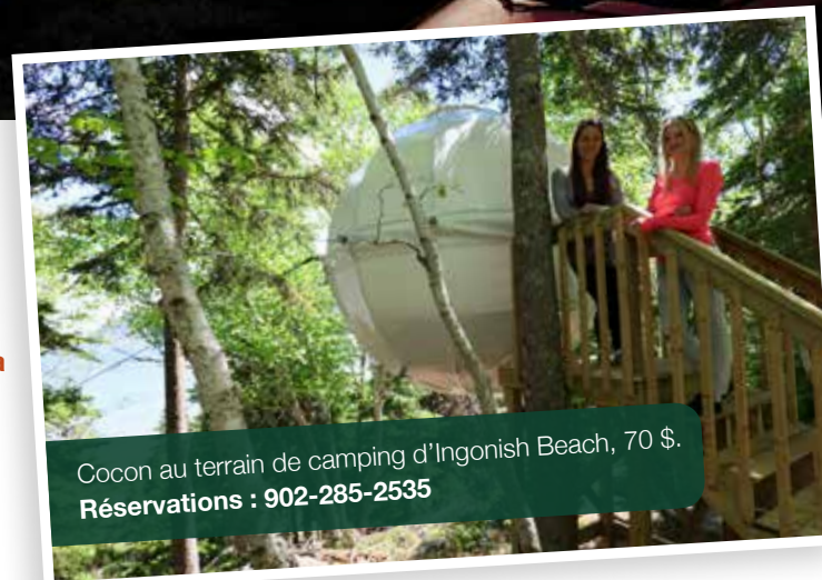
Cocon au terrain de camping d'Ingonish Beach, 70 $. Réservations : 902-285-2535

Les tarifs pour les sites de camping dans l'avant-pays commencent à 17,60 $. Profitez d'un rabais de 15 % pour un séjour de 7 nuits consécutives ou plus! Pour réserver un site de camping à Broad Cove, à Ingonish Beach ou à Chéticamp : www.reservation.parcscanada.gc.ca ou 1 877 737-3783.