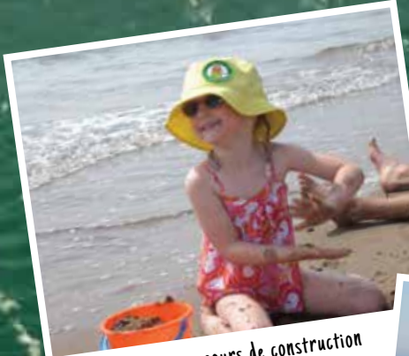
Organisez un concours de construction de châteaux de sable...