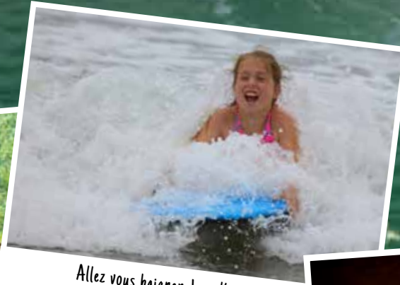
Allez vous baigner dans l'eau douce ou salée à la plage d'Ingonish.