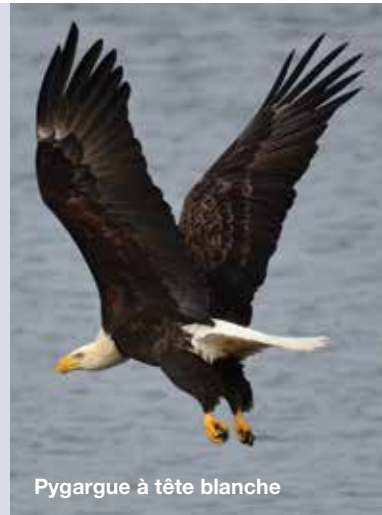
Pygargue à tête blanche

9 Guillemot à miroir – Gardez l'œil ouvert pour apercevoir les pattes rouge vif de cet oiseau dans les zones côtières dominées de falaises, et à Middle Head, l'anse Green, l'anse Fishing et au Buttereau ainsi que sur l'île de Chéticamp.