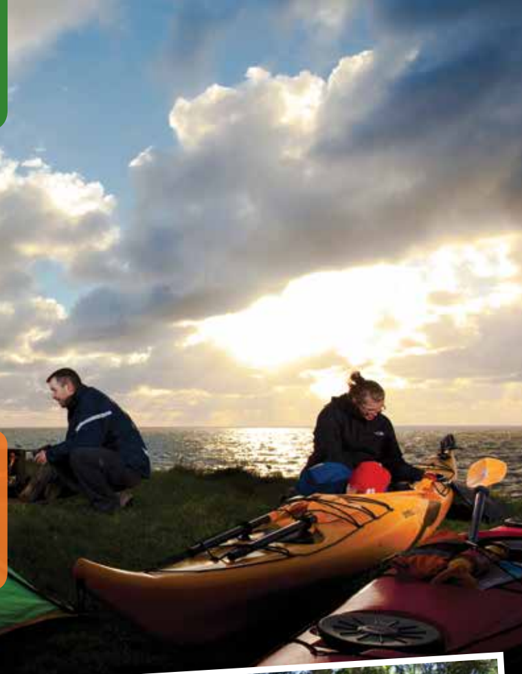
Terrain de camping de la rivière à Lazare

Que vous préférez un site de camping sauvage, un site avec services complets pour VR, un site traditionnel pour tente, ou le NOUVEAU camping confort sans tracas, il suffit de faire un choix pour vivre les plaisirs du camping!