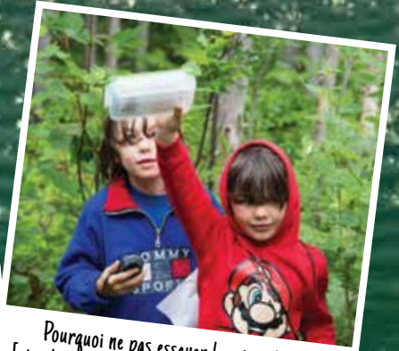
Pourquoi ne pas essayer la géocachette [et aider Parka à trouver son chapeau] avec les « Caches de Parka dans les terrains de camping ».