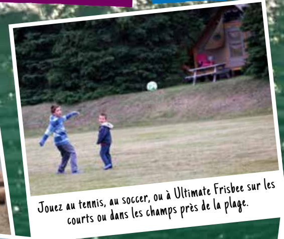
Jouez au tennis, au soccer, ou à Ultimate Frisbee sur les courts ou dans les champs près de la plage.