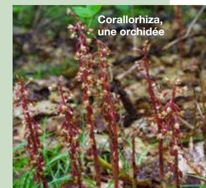
Corallorhiza, une orchidée

10 Hudsonie éricoïde – Une espèce en péril, cette fleur jaune vif minuscule mais robuste est visible au début de l'été sur le promontoire rocheux du sentier Skyline. Le piétinement excessif représente une menace constante pour sa survie.