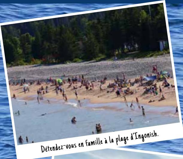
Détendez-vous en famille à la plage d'Ingonish.