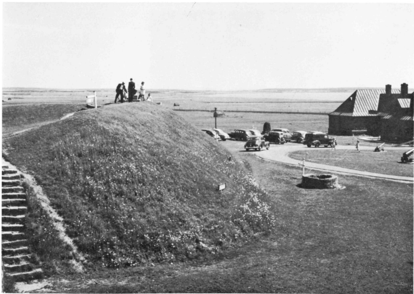
Bastion de terre qui date de la période française