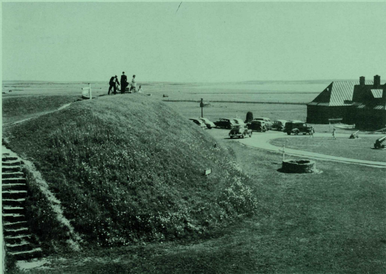
Bastion de terre qui date de la période française