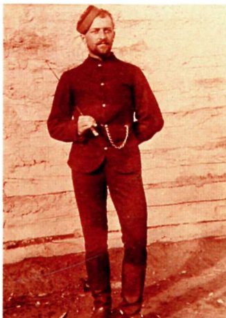
In 1885 there were 112 men stationed at Battleford, the largest mounted police division then in the North-West. En 1885, 112 hommes étaient stationnés à Battleford, la plus grande division de la Police à cheval du Nord-Ouest à cette époque.