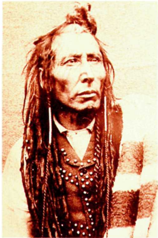
Poundmaker, the adopted son of Chief Crowfoot. Poundmaker, fils adoptif du chef Crowfoot.

COVER The wooden stockade around Fort Battleford was a symbol of shelter to settlers in the area.