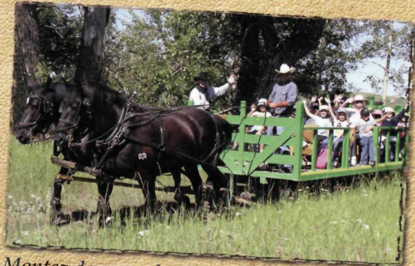
Montez dans un chariot et découvrez la puissance des Percherons qui vous transporteront durant votre visite du site.