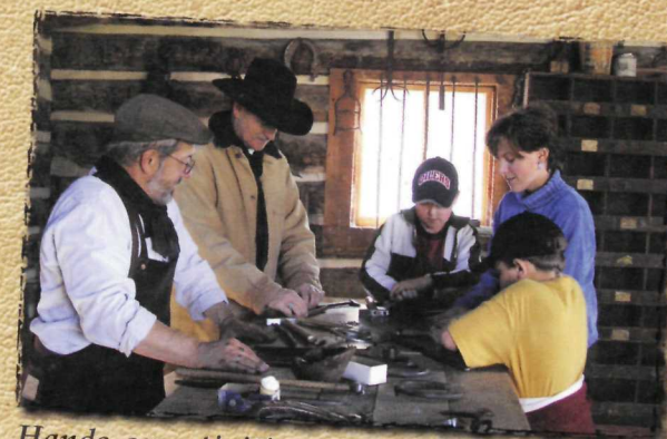
Hands-on activities at the Bar U take you back to the ranch life of yesteryear.