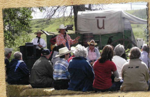
Immerse yourself in stories of ranching pioneers...fortunes made and lost, cattle-killing winters and massive roundups.