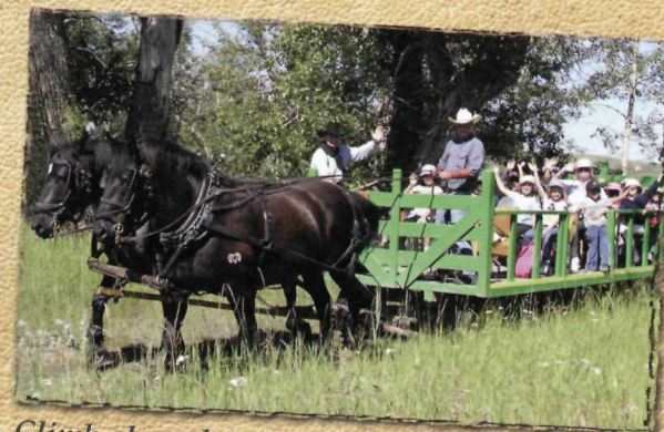
Climb aboard our wagon and feel the power of the Percherons as they tour you through the site.