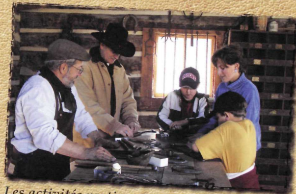
Les activités pratiques organisées au ranch Bar U font revivre l'époque des ranchs d'antan.