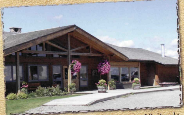
Découvrez l'hospitalité de l'Ouest – Visitez le Centre d'accueil pour vous régaler d'un bon repas maison et flâner dans notre boutique de cadeaux.

Galles (qui plus tard, devenu Édouard VIII, allait renoncer à la couronne d'Angleterre), et Harry Longabaugh (mieux connu sous le nom de Sundance Kid). Découvrez nos pâturages sur la trace de ces géants de l'Ouest et entrez dans l'histoire passionnante des ranchs du Canada.