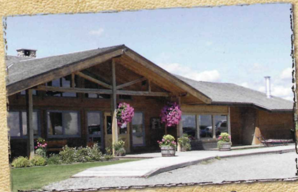
Experience Western Hospitality - Come on into the Visitor Centre, enjoy a home cooked meal and check out our western Gift Shop.

were among the famous, and sometimes infamous, characters who graced the ranch's vast expanse at various times. Walk the very ranges that the giants of the west walked and take a journey into Canada's exciting ranching history.