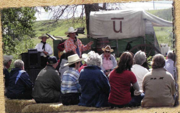
Découvrez les histoires des premiers exploitants de ranchs... les fortunes faites et perdues, les hivers meurtriers pour le bétail et les immenses rassemblements de bêtes.