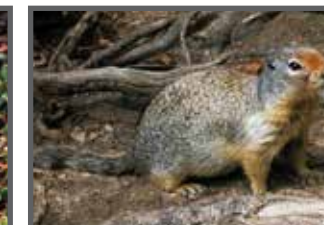
Spermophile du Columbia