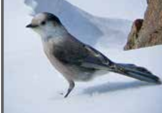
Mésangeai du Canada