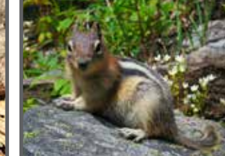
Spermophile à mante dorée