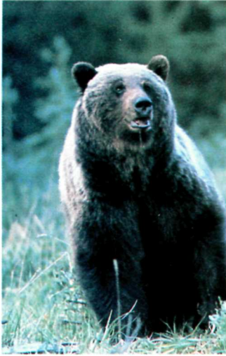
Only 60-80 grizzly bears live in Banff National Park. Le parc national Banff ne compte pas plus de 60 à 80 grizzlis.