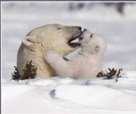
Polar Bears/Thorsten Milse Ours polaires/Thorsten Milse