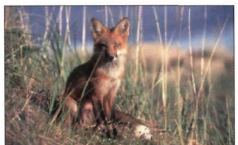
Fox/Norbert Rosing Renard/Norbert Rosing

a/s Parcs Canada C.P. 127 Churchill, MB R0B 0E0 Téléphone : 1-888-773-8888 204-675-8863 Télécopieur : 204-675-2026 Courriel : wapusk.np@pc.gc.ca www.pc.gc.ca/wapusk