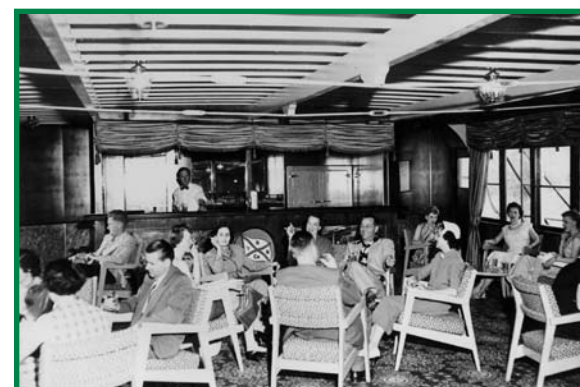
Vancouver Maritime Museum

Sur le chemin du retour, il s'arrêtait d'abord à Stewart Landing, où on le chargeait de minerai d'argent et de