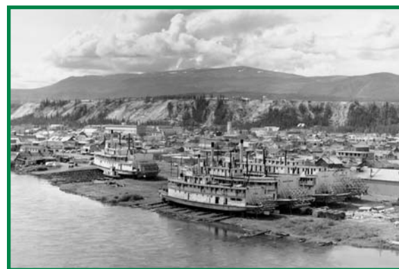
Archives du Canada

L'histoire du transport parle de Whitehorse comme d'un centre de transfert entre le train et le bateau-vapeur et d'un site de chantiers maritimes et de rampes important. Parmi les autres sites faisant aussi partie de l'histoire, on trouve le MV Tarahne à Atlin, la rivière du patrimoine The Thirty Mile, le lieu historique national S.S. Keno, Canyon City, Fort Selkirk et le lieu historique national du Complexe-Historique-de-Dawson.