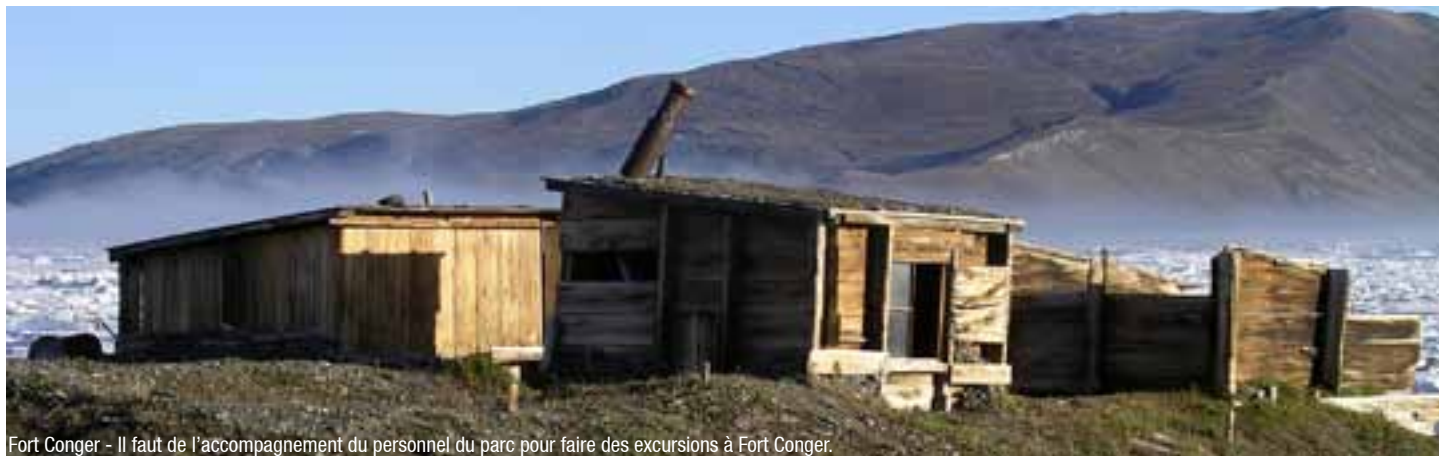
Fort Conger - Il faut de l'accompagnement du personnel du parc pour faire des excursions à Fort Conger.

Votre groupe devrait posséder de très bonnes compétences en secourisme en milieu sauvage et être prêt à traiter toute urgence médicale ou urgence liée à la faune ou aux conditions météorologiques. Si un membre de votre groupe n'est pas certain de son niveau d'habileté, envisagez de voyager avec un guide expérimenté. Vous trouverez des coordonnées dans le guide.