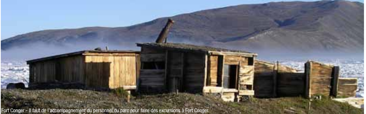
Fort Conger - Il faut de l'accompagnement du personnel du parc pour faire des excursions à Fort Conger.

Votre groupe devrait posséder de très bonnes compétences en secourisme en milieu sauvage et être prêt à traiter toute urgence médicale ou urgence liée à la faune ou aux conditions météorologiques. Si un membre de votre groupe n'est pas certain de son niveau d'habileté, envisagez de voyager avec un guide expérimenté. Vous trouverez des coordonnées dans le guide.