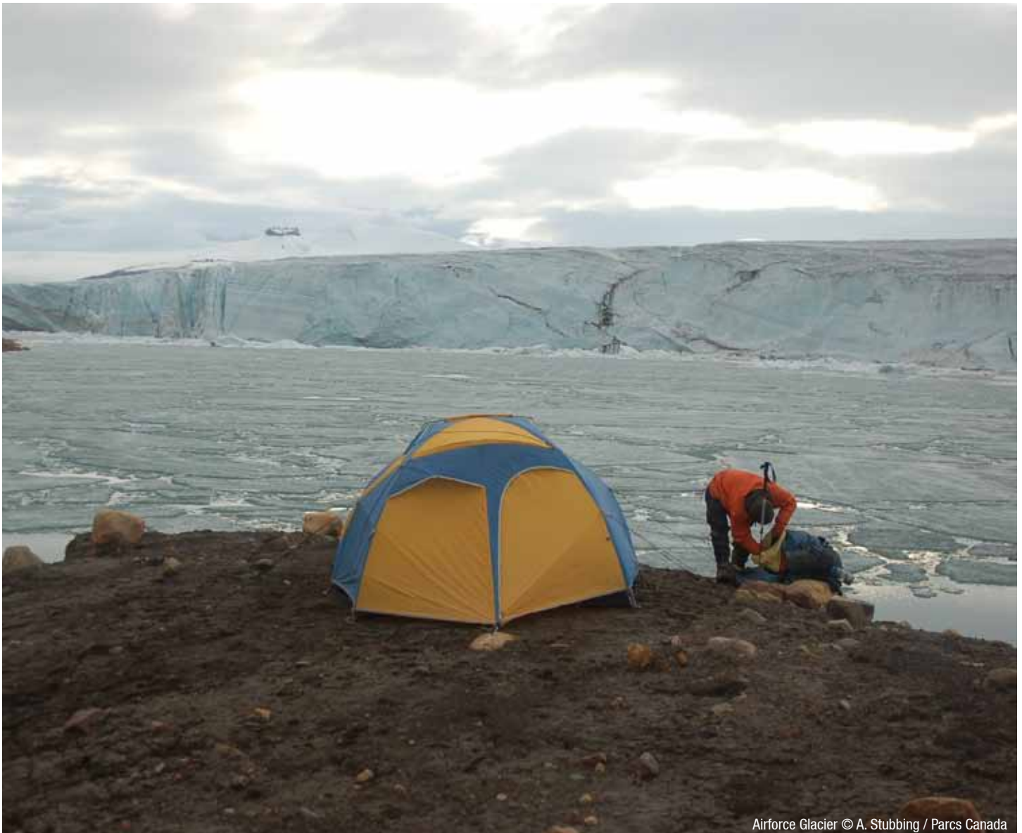
Airforce Glacier

Les laissez-passer Découverte de Parcs Canada qui comprennent les droits d'entrée aux parcs ne sont pas valides dans les parcs nationaux du Nunavut.