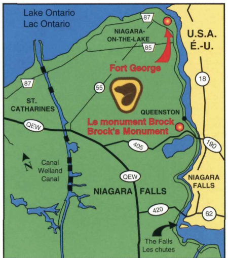
La dernière demeure du major général sir Isaac Brock, sauveur du Haut-Canada