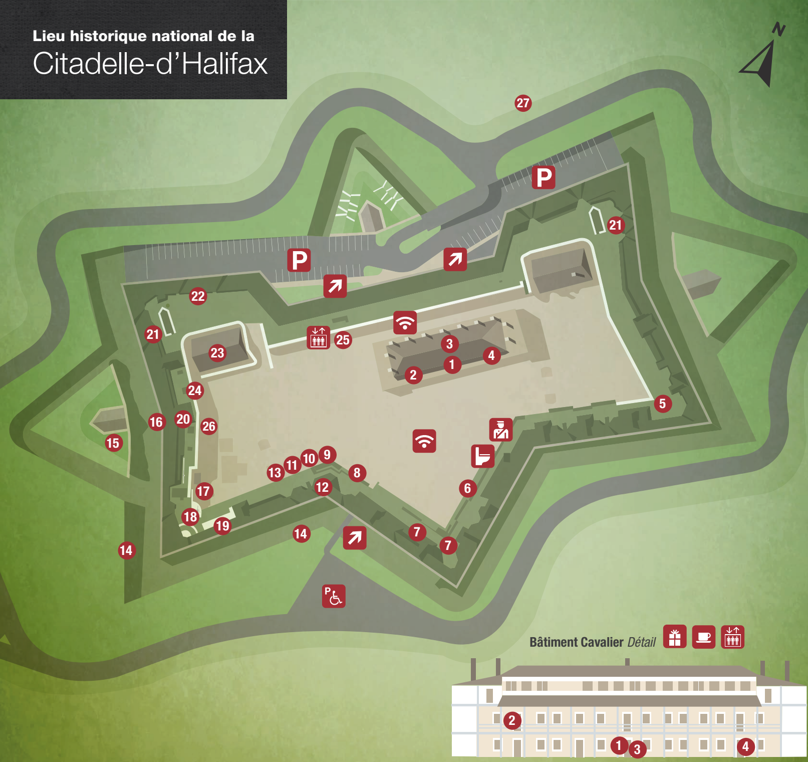
Bâtiment Cavalier Détail