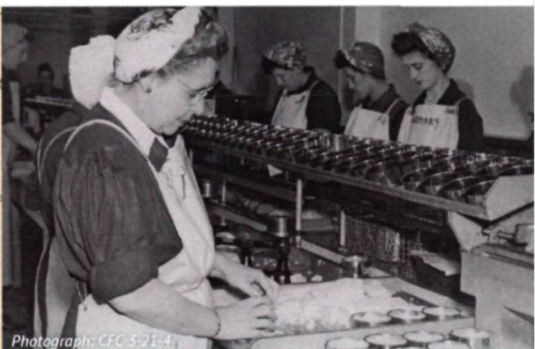
Photograph: CFC 5-21-4