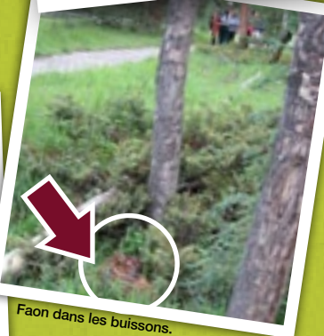
Faon dans les buissons.