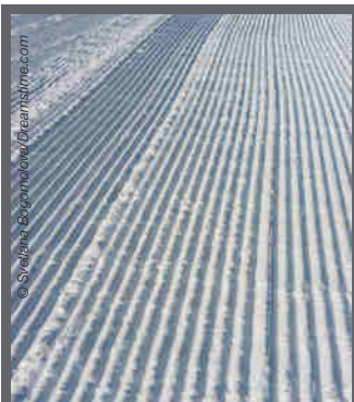
Damage à plat pour les autres usagers

Dans le parc national Banff, nous partageons les sentiers :