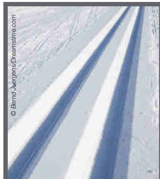
Traçage pour le ski classique