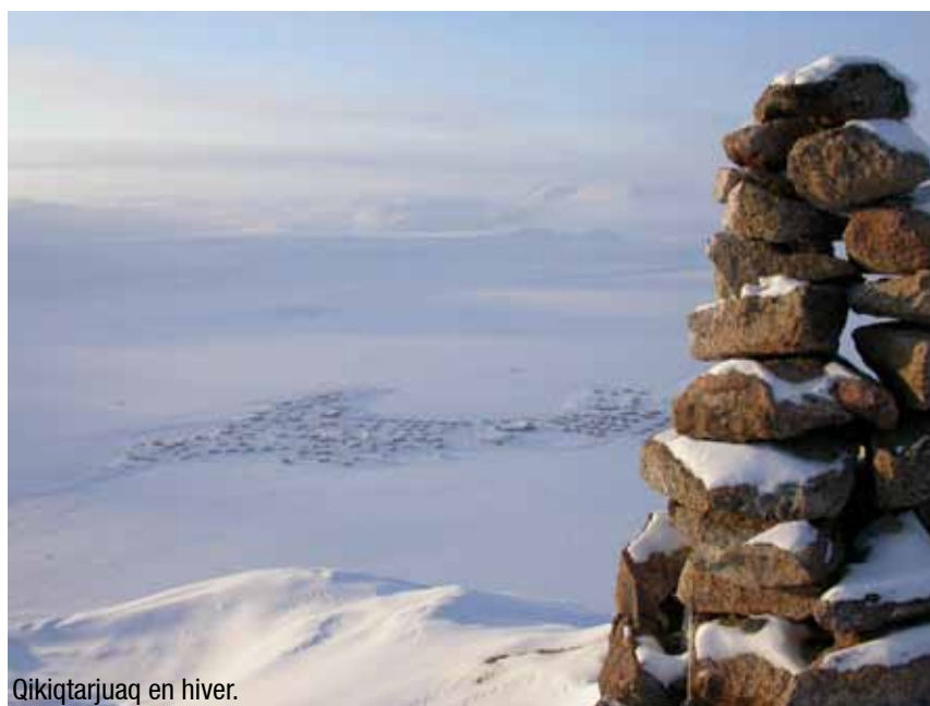
Qikiqtarjuaq en hiver.