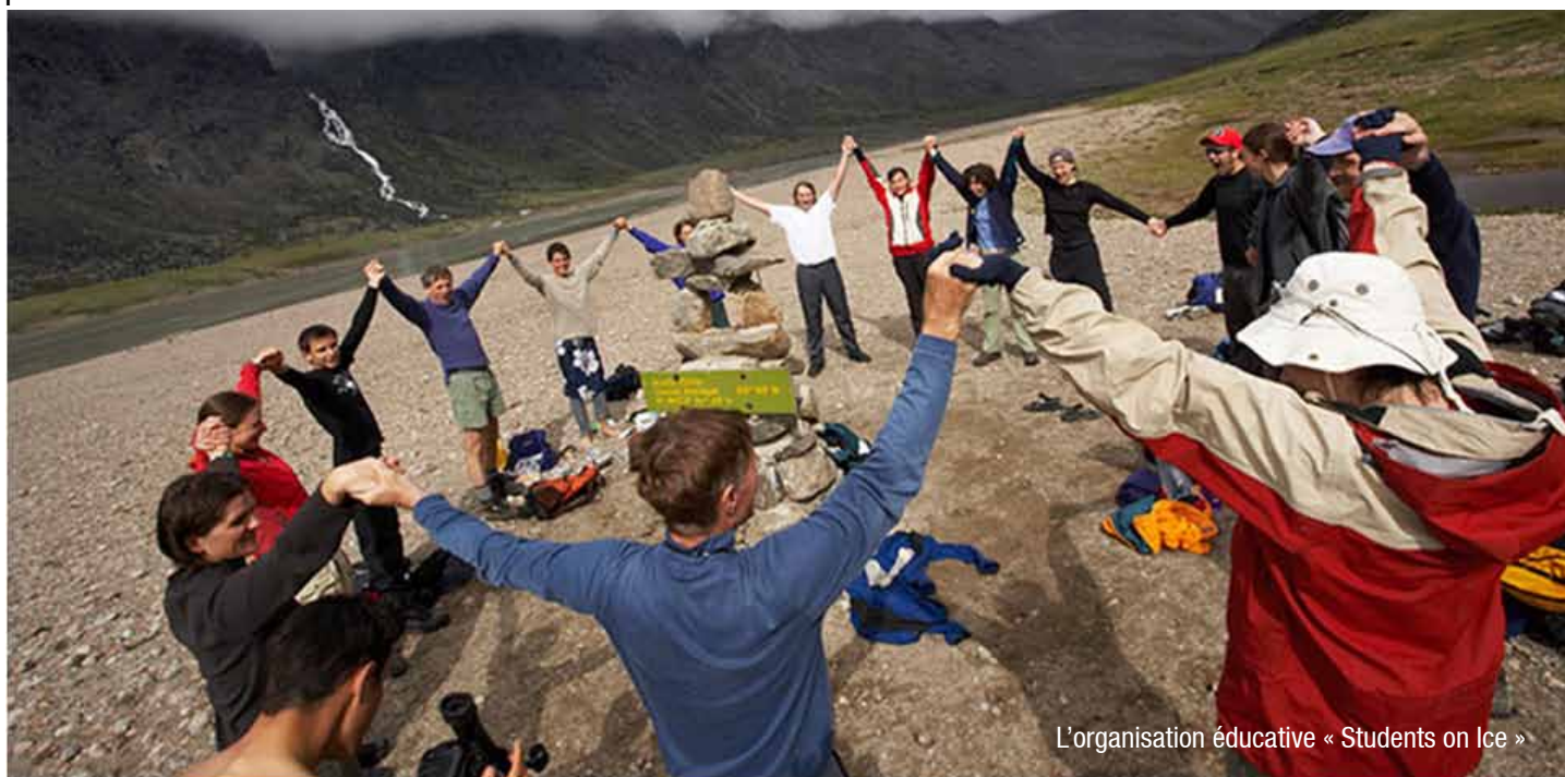
L'organisation éducative « Students on Ice »

Si vous n'avez que quelques jours pour visiter Auyuittuq, plusieurs possibilités s'offrent à vous. Pourquoi ne pas faire une excursion en bateau à partir de Qikiqtarjuaq pour aller admirer les glaciers et les montagnes? Ou encore une expédition en motoneige ou une randonnée au cercle polaire à partir de Pangnirtung? Les excursions de randonnée, de ski et les visites guidées en bateau ou en motoneige offertes par des pourvoyeurs sont des options offertes dans les deux collectivités. Communiquez avec notre bureau ou un pourvoyeur directement pour discuter de l'excursion la plus appropriée pour vous.