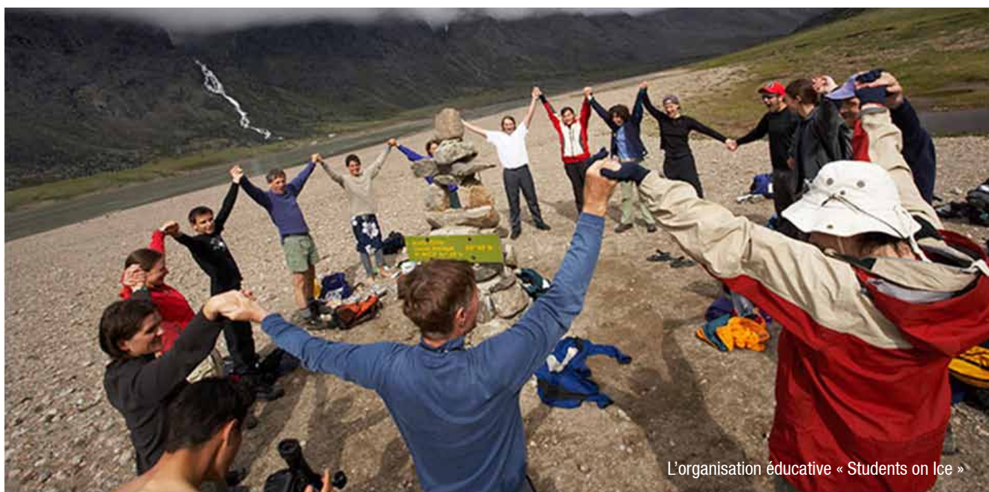
L'organisation éducative « Students on Ice »

Communiquez avec notre bureau ou un pourvoyeur directement pour discuter de l'excursion la plus appropriée pour vous.