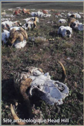
Site archéologique Head Hill